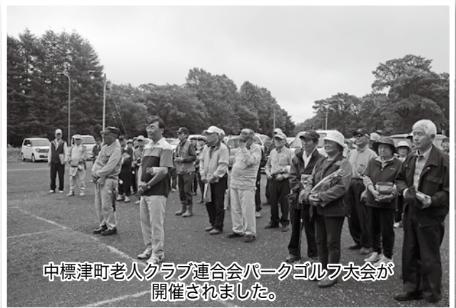
中標津町老人クラブ連合会パークゴルフ大会が開催されました。