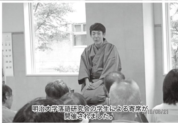
明治大学落語研究会の学生による寄席が 開催されました。19/08/21