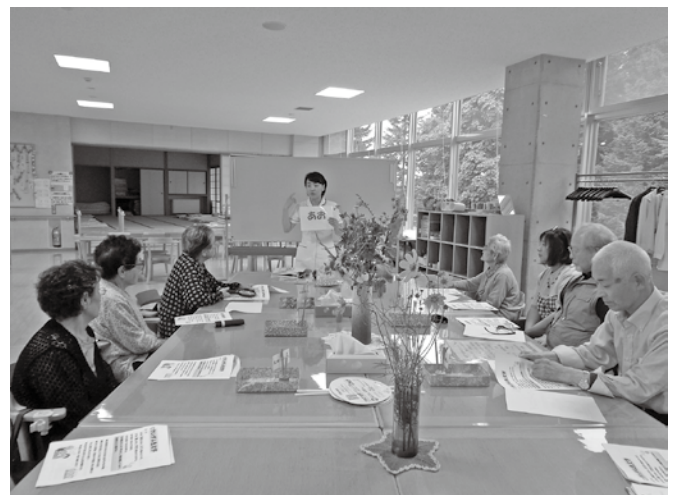
認知症予防脳トレーニングの様子