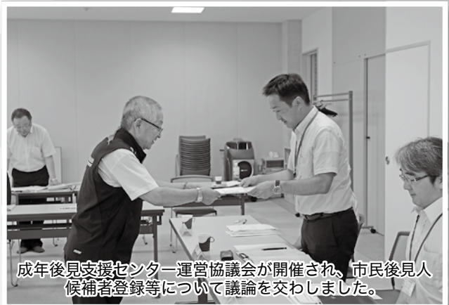
成年後見支援センター運営協議会が開催され、市民後見人候補者登録等について議論を交わしました。