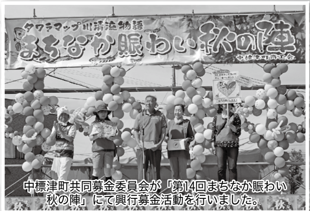
中標津町共同募金委員会が「第14回まちなか賑わい秋の陣」にて興行募金活動を行いました。