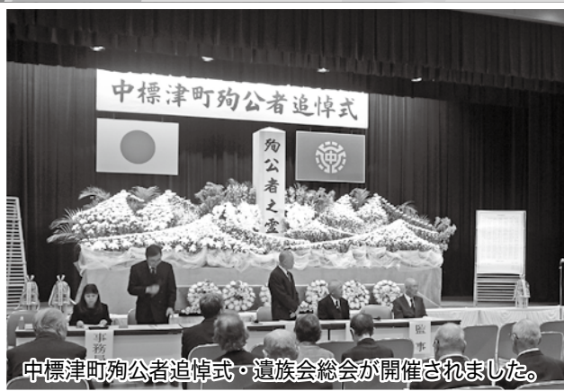
中標津町殉公者追悼式・遺族会総会が開催されました。