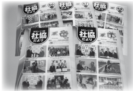
社協だより調査広報事業