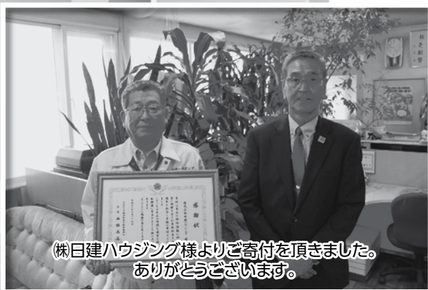
㈱日建ハウジング様よりご寄付を頂きました。 ありがとうございます。