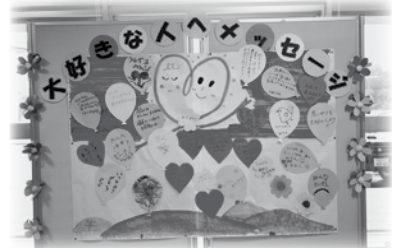
思いやりメッセージコーナーでは、大切な人へをテーマにメッセージを書いて頂きました。とてもあたたかいメッセージでいっぱいになりました！