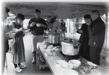
災害対策コーナーでは、町内会のご協力のもと参加者が100円ショップで購入できるビニール袋を使ってご飯を炊き、ポテトサラダを作る体験を行い、美味しく頂きました。