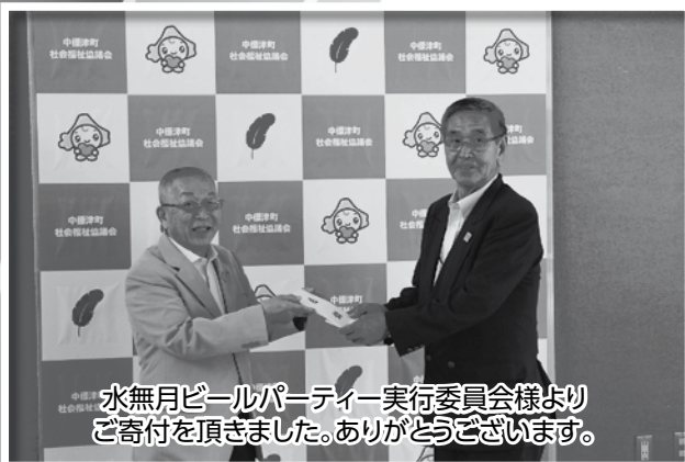
水無月ビールパーティー実行委員会様より ご寄付を頂きました。ありがとうございます。