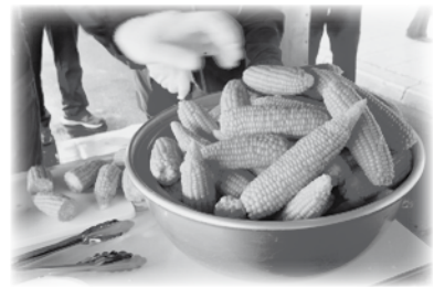
レスキューキッチンでは、とうきび70本を茹でて美味しく頂きました。