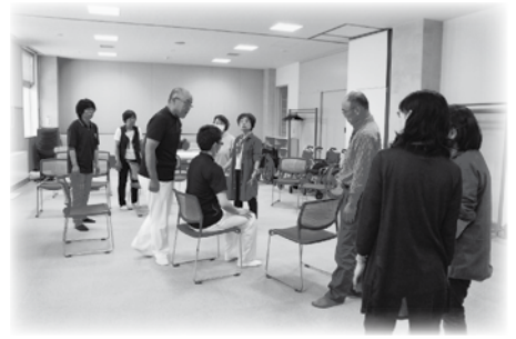
家族のための在宅介護講座