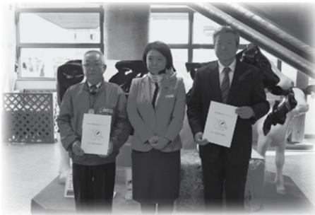
空の第1便・セレモニー