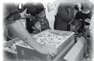
もちまき・お菓子まき(悪天候のため手配りさせて頂きました。)