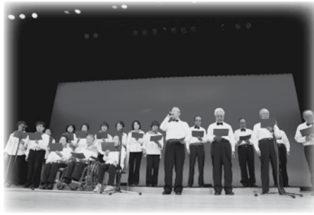
中標津町老人親睦芸能発表会