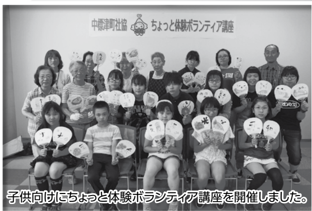
子供向けにちよっと体験ボランティア講座を開催しました。