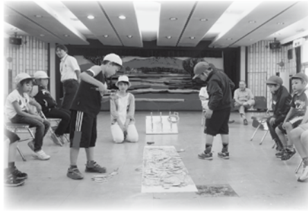
ふれあいいきいきサロン活動の支援