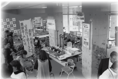
介護用品展示コーナーでは、さまざまな介護用品があり、注目を集めていました。