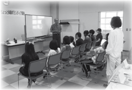
ちょっと体験ボランティア講座