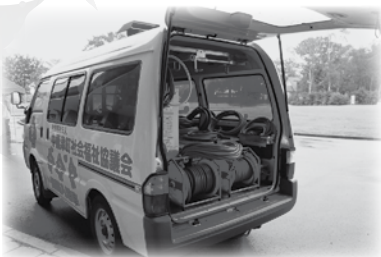
訪問入浴車の展示を行うとともに、パネルで訪問入浴の作業内容を理解していただきました。