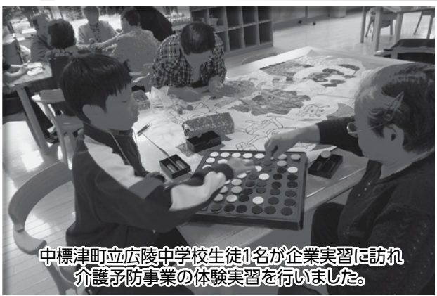
中標津町立広陵中学校生徒1名が企業実習に訪れ 介護予防事業の体験実習を行いました。