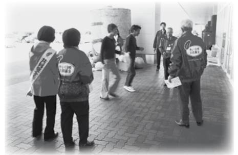
赤い羽根共同募金運動啓発活動