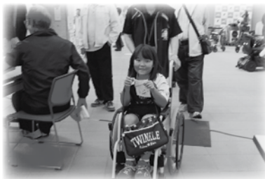
プラットクイズラリーでは、会場内を車いすで移動クイズに答えながら周り、参加者には景品がプレゼントされました。