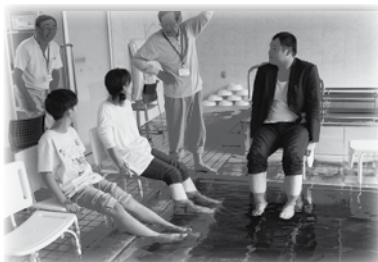
通所予防の浴室を開放した足湯コーナー、とても気持ちがいいと好評でした。