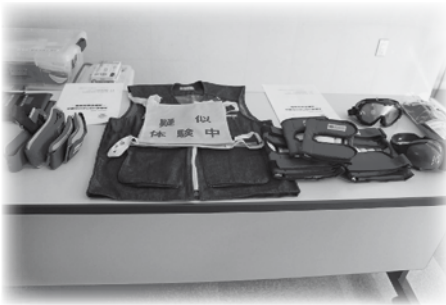
高齢者疑似体験セットの貸出

皆様からお寄せいただいた募金は、今年このような事業に使われ、 たくさんの方々に役立てられています。