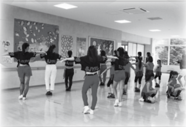
JAZZ DANCE RIOの皆様が素敵なダンスで盛り上げてくれました。ありがとうございました！