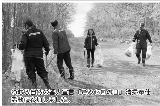
ねむろ自然の番人宣言「ごみゼロの日」清掃奉仕 活動に参加しました。