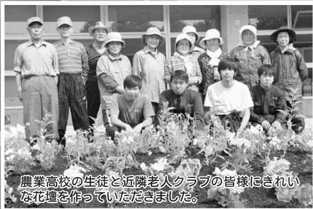
農業高校の生徒と近隣老人クラブの皆様にきれいな花壇を作っていただきました。