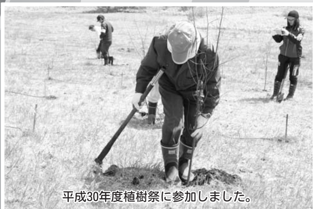
平成30年度植樹祭に参加しました。