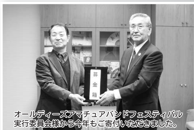
オールデイズアマチュアバンドフェスティバル 実行委員会様から今年もご寄付いただきました。