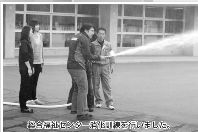
総合福祉センター消化訓練を行いました。