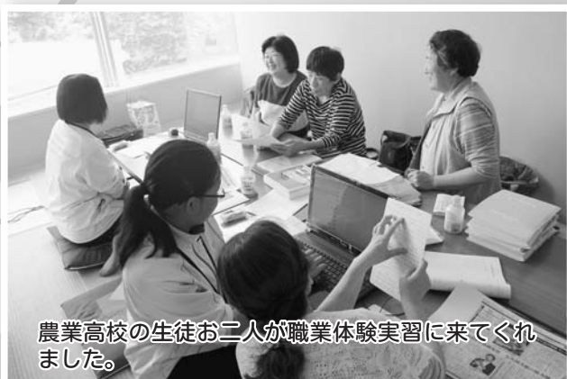
農業高校の生徒お二人が職業体験実習に来てくれました。