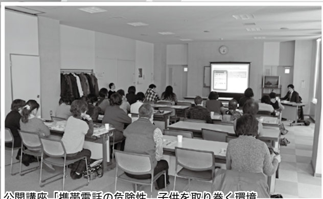
公開講座「携帯電話の危険性、子供を取り巻く環境、 保護者ができるポイント」について、 中標津町更生保護女性会の主催で行われました