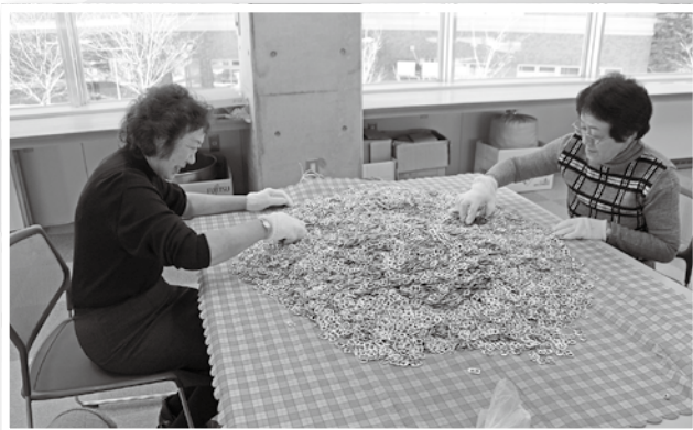
町民から寄せられたリングブルの仕分け作業を ボランティアが行っている様子です