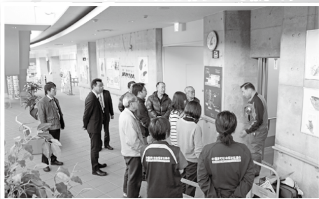
福祉センター入居機関で エレベーター閉じ込め訓練を行いました