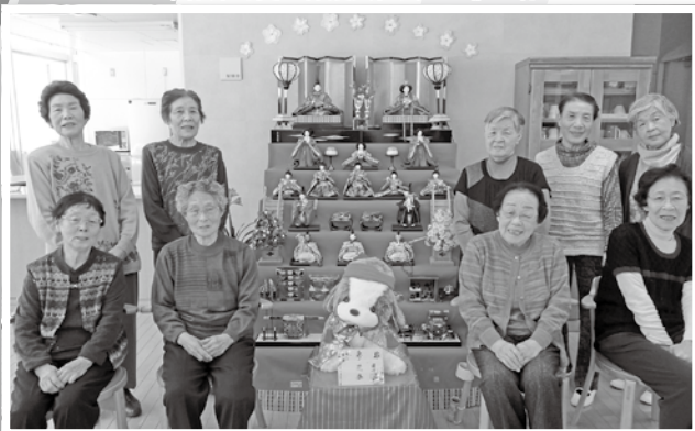
中標津町通所介護予防事業「おたっしや運動教室」 の様子です