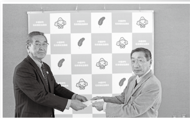
中標津しらかば学園様より寄付を頂きました