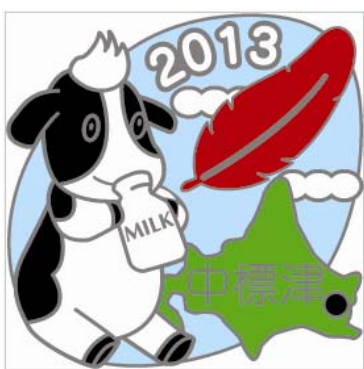
中標津町共同募金委員会限定バッジ