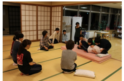
ミーティングの様子、今回は訪問入浴と共に「安全・安楽な移動について」行いました。

中標津公共職業安定所に求人広告を掲載しておりますのでお問い合わせください。スタッフ一同、心よりお待ちしております。