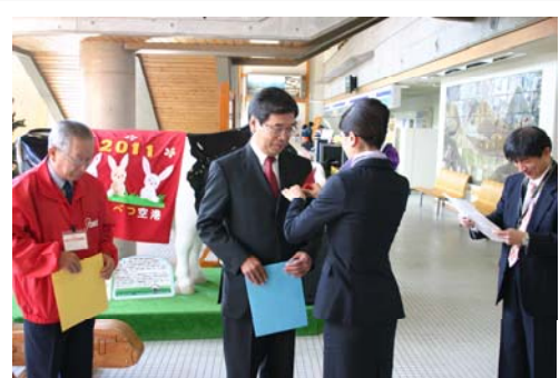
大きな赤い羽根が東京から届けられます

毎年10月1日には、募金活動が始まる日として、赤い羽根共同募金出発式を行った後、町内4店舗で赤い羽根を使った募金啓発活動を行っています。また、その後は「空の第一便」として東京便に乗った厚生労働大臣と中央共同募金会会長からのメッセージが伝達されています。