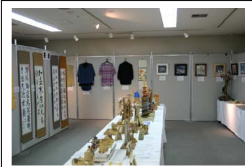
昨年の展示品の一部

中標津町老人クラブ連合会主催で第37回中標津町老人作品展示会を平成25年10月10日(木)午後1時～14日(月)正午までの期間、中標津町総合文化会館(しるべつと)展示室にて行ひます。 書道、絵画、手芸品や工芸品を展示する予定であり、数多くの力作が揃ひます。