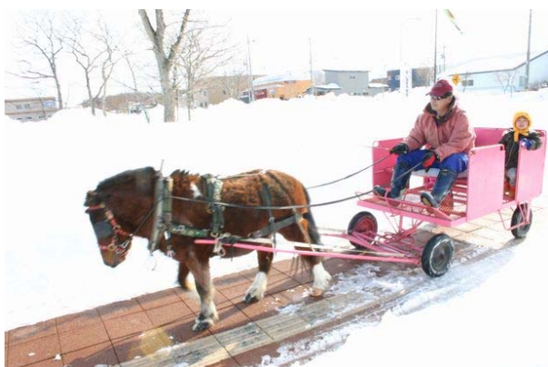
ポニー馬ぞり試乗体験

喫茶サロン「ぼれぼれ」ではコーヒーなどの飲み物を、柏の実学園「オーク」からはパンの販売がされており、休憩しながら味わうことができました。